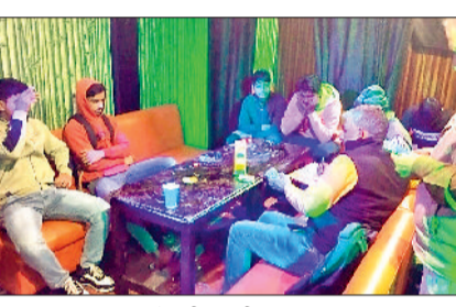
सीएम फ्लाइंग हुक्का बार पर छापेमारी करती।