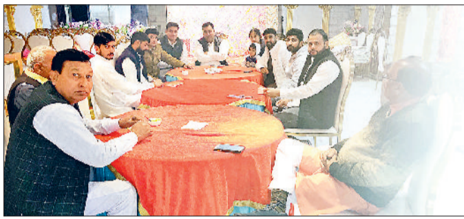
रोहतक। एक होटल में बैठे जिला पार्षद।