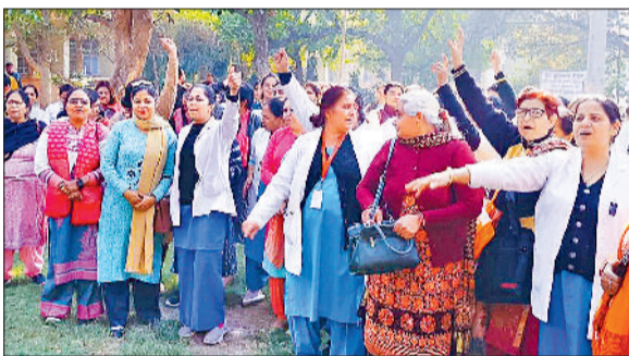
रोहतक। मांगों को लेकर नारेबाजी करता नर्सिंग स्टाफ।