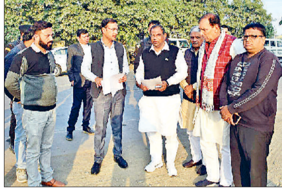
रोहतक। पुरानी आईटीआई में निरीक्षण करते राज्यमंत्री।