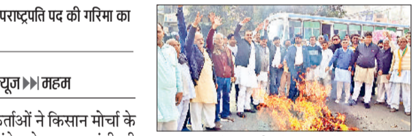
महम। कस्बे के भिवानी स्टैंड पर कांग्रेस नेता राहुल गांधी का पुतला फूँकते भाजपा कार्यकर्ता।